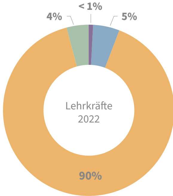
Höchster Bildungsabschluss (n = 1.045)